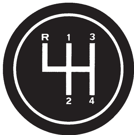
4-växlad helsynkroniserad växellåda.

Volvo Amazon är lätt att parkera. Vändradien är endast 4,8 m.