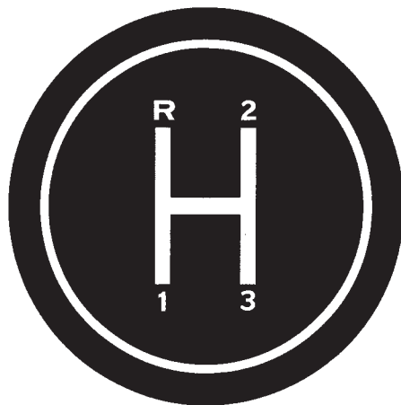
3-växlad helsynkroniserad växellåda.